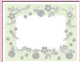
SE0019 シルバーアップル