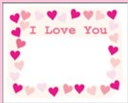
SE0002 I LOVE YOU