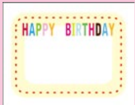
SE0014 HAPPY BIRTHDAY